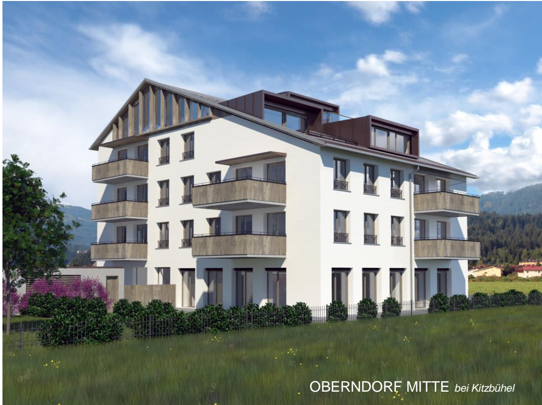
OBERNDORF MITTE bei Kitzbühel