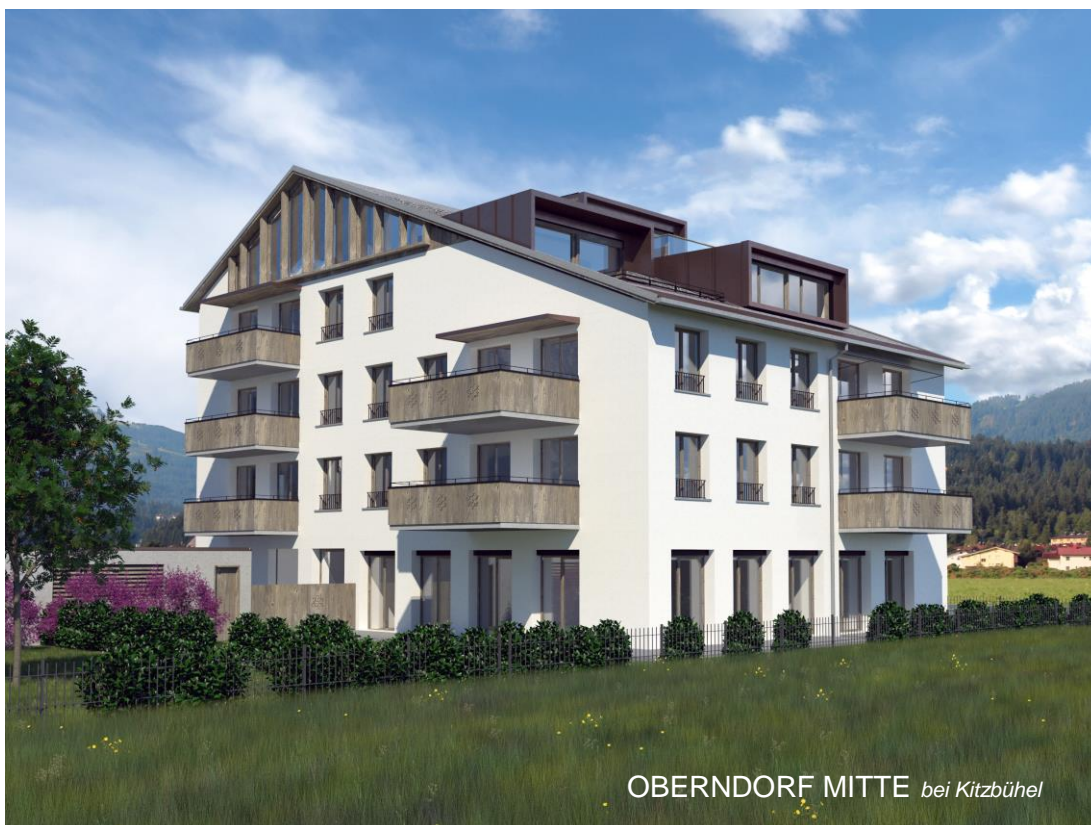
OBERNDORF MITTE bei Kitzbühel