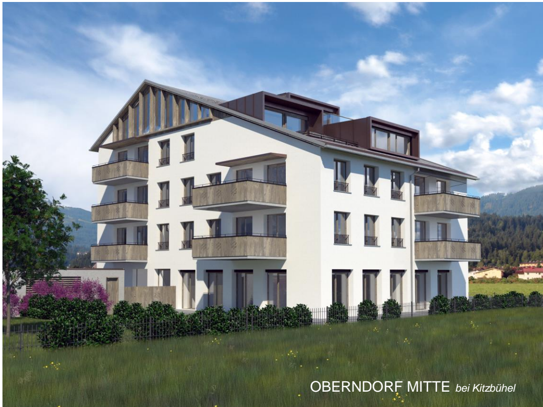
OBERNDORF MITTE bei Kitzbühel