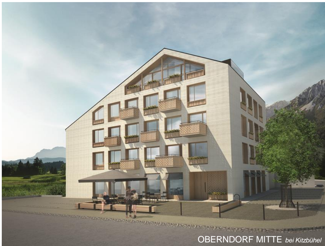
OBERNDORF MITTE bei Kitzbühel